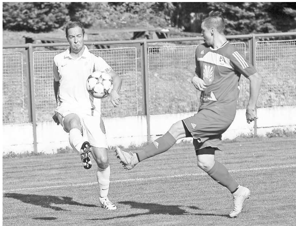
SBÍRAJÍ BODY. Žirovnici se zápasy s týmy ze Žďárska povedly. Před týdnem doma porazila béčko Velkého Meziříčí, v sobotu odvezla z Nové Vsi cenný bod.

Hosté mohli jít dokonce do vedení, jenže Hřebecký po úniku páli do tyče. Skóre se herní aktivě začalo podobat po hodině hry, kdy rozjásal domácí úvodním gólem zápasu Komínek. Jenže